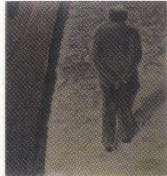
Arnold Schönberg Gehendes Selbstportrait, 1911 Self portrait, walking, 1911