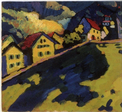
Wassily Kandinsky Murnau - Sommer- landschaft, 1909 Murnau - Summer Landscape, 1909