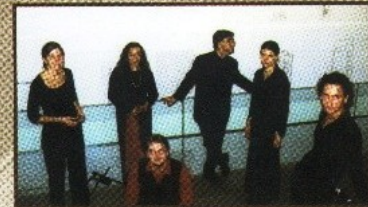
Ensamble Pierrot Lunaire